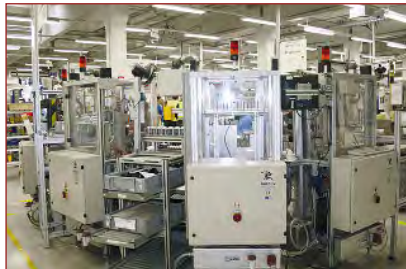
Blick in die Fertigung bei Autoliv in Döbeln.

20 Jahre Autoliv Sicherheitstechnik in Döbeln