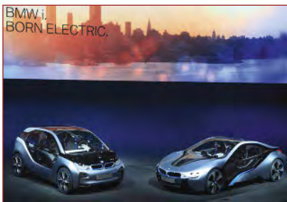
Die Studien des Elektrofahrzeugs BMW i3 und des Hybrid-Sportwagens i8. Beide Fahrzeuge werden in Leipzig produziert.

Konzern präsentierte Konzeptfahrzeuge der neuen Submarke BMW i