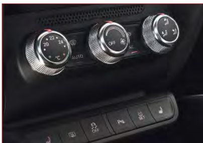
Know-how aus Auerbach steckt in der Schalterleiste des Audi A1.

Schalter und Bedienmodule der EAO Automotive GmbH & Co. KG Auerbach/Vogtl. sind in den Fahrzeuginnerräumen vieler europäischer Pkw-Modelle zu finden. Das Unternehmen der Schweizer EAO-Gruppe hat im 20. Jahr seines Bestehens die Position als Automotive-Kompetenzzentrum des Konzerns erneut gefestigt. Wurden in den Gründungsjahren hauptsächlich Schaltelelemente für industrielle Anwendungen gefertigt, so dominiert heute der Automobilbereich das Geschäft mit 87 Prozent.