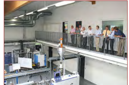
Die Teilnehmer der AMZ-Informationsveranstaltung nutzen das Angebot, das neue Polysax-Technikum in Bautzen zu besichtigen.