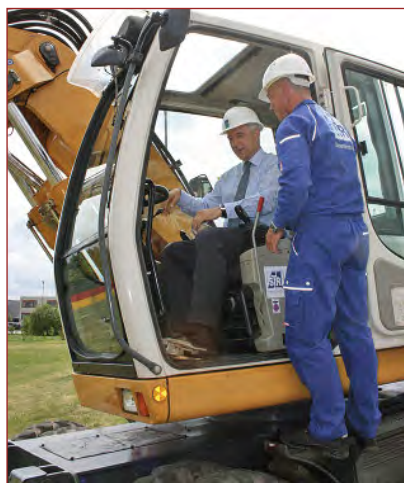
Ministerpräsident Stanislaw Tillich nahm bei Magnetto in Treuen den ersten Baggeraushub für die Halle vor, in der künftig eine neue, hochleistungsfähige Transferpresse arbeiten wird.

Dank der Investition sei Magnetto in der Lage, ein völlig anderes Teilespektrum als auf den vorhandenen beiden Pressenlinien zu fertigen. „Das sichert Wettbewerbs-