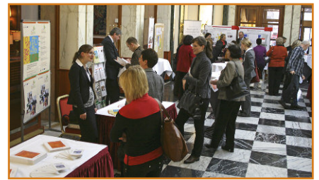
In der begleitenden Ausstellung stellten sich sächsische Projekte zum Thema Familienfreundlichkeit vor.