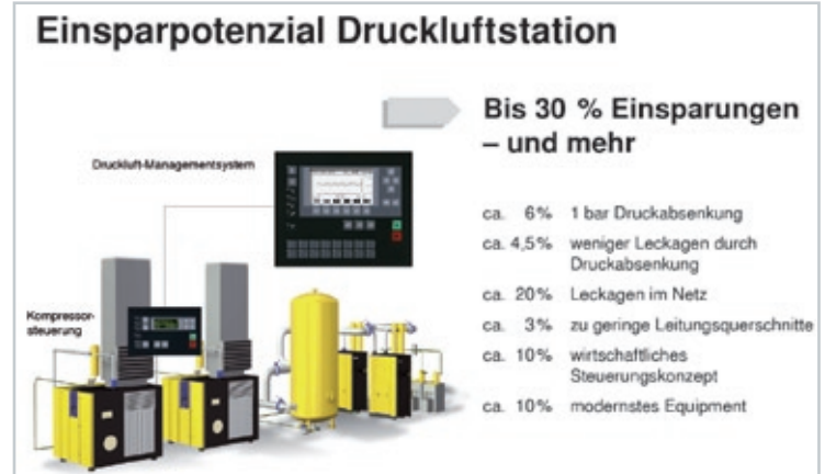
Abb. 2: Einsparpotenziale bei Druckluftsystemen (siehe Anmerkung 3)

Nach der Datenerhebung errechnet eine spezielle Software den Energiebedarf der analysierten Station und stellt ihn dem einer optimierten Station gegenüber. Die Software kann außerdem alternative Systemvarianten simulieren. Aus dem Vergleich dieser Varianten und einer Amortisationsberechnung ergibt sich dann für den Fachmann der Umfang der erforderlichen Optimierung: Neukonfiguration des Anlagenbestands, teilweiser oder vollständiger Ersatz. Erfahrungsgemäß lässt sich durch Druckabsenkung, Verringern der Verluste durch Leckagen, effiziente kompressorinterne und übergeordnete Steuerung und modernste Systemkomponenten viel Energie einsparen. Ganz erheblich ist der zusätzliche Einspareffekt durch Nutzen der Kompressorabwärme über ein Wärmerückgewinnungssystem: Immerhin lassen sich so bis zu 94 Prozent der einem Kompressor zugeführten elektrischen Leistung wärmetechnisch nutzen.