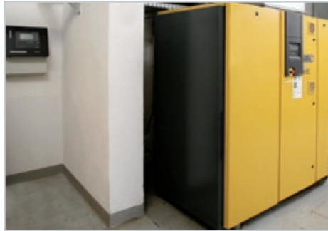
Kompressorstation mit übergeordneter Steuerung (Ausschnitt)

ge ersetzt werden. Insgesamt ergeben sich umfassende Optimierungen.